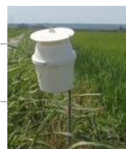
Piège à pyrale